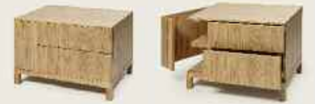
Ada nightstand Ada Nachttisch