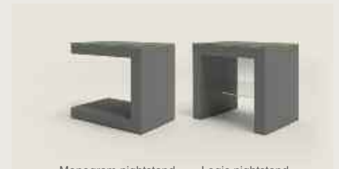
Monogram nightstand Monogram Nachttisch