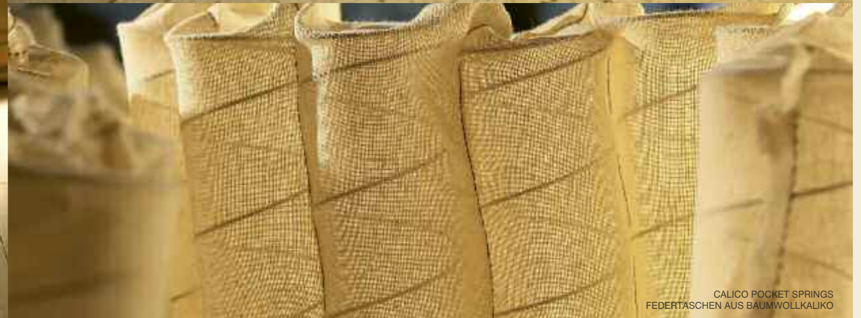
CALICO POCKET SPRINGS FEDERTASCHEN AUS BAUMWOLLKALIKO