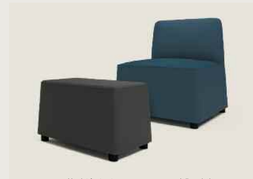
Harriet footrest Harriet Fußstütze