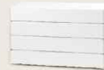
Mary drawer Mary Schublade