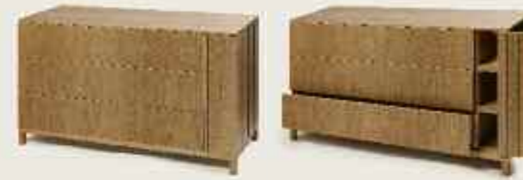
Ada drawer Ada Schublade