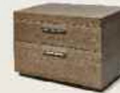
Johan nightstand Johan Nachttisch