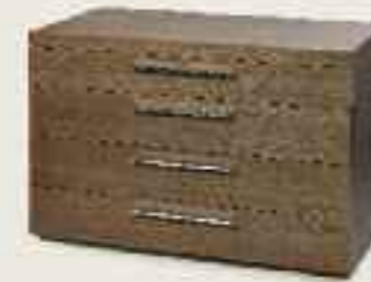
Johan drawer Johan Schublade