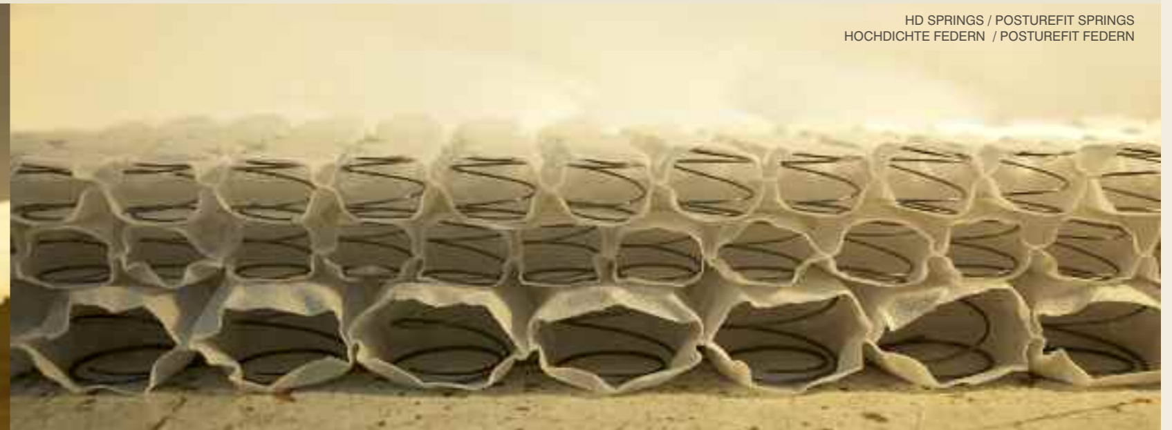
HD SPRINGS / POSTUREFIT SPRINGS HOCHDICHTE FEDERN / POSTUREFIT FEDERN