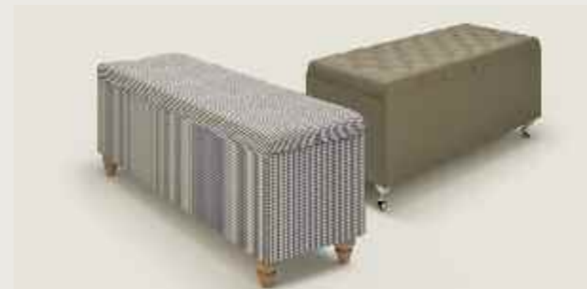
Fantasy storage box Fantasy Bettbox